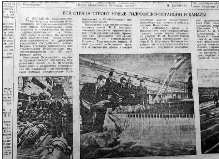
«Забайкальский рабочий» много писал о достижениях советских энергетиков.

Полгода назад «Забайкальский рабочий», ПАО «ТГК-14» и «Россети Сибирь» запустили совместный информационный проект, призванный познакомить читателей с историей электрификации Забайкальского края. Общими усилиями мы осветили пройденный от первой зажженной лампочки 1897 года до энергетических подвигов забайкальцев времен Великой Отечественной войны путь. Настало время пролить свет на следующую веху в истории электрификации. И сегодня мы отмечаем время до 1946 года — года окончания войны и начала нового, четвертого пятилетнего плана развития СССР — и посмотрим, что об этом писала наша газета.