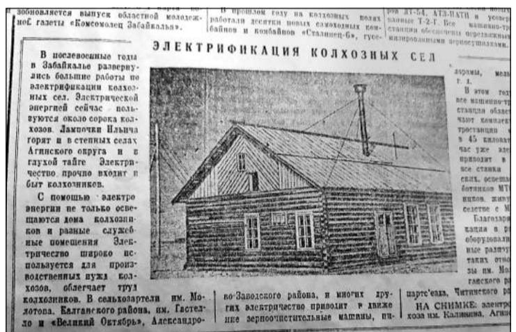
Колхозные электростанции освещали все общественные здания, постройки и фермы.

Но даже у таких, казалось бы, идеальных станций по произ-