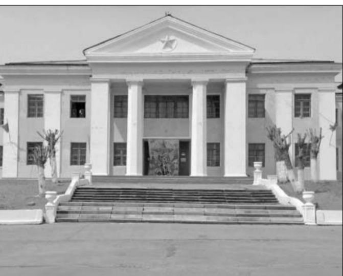
Капитальный ремонт Дома культуры в Ясной, построенного в 40-х годах прошлого века, проводится впервые.

— На данный момент освоено более пяти миллионов рублей. Мы осмотрели два этажа здания. Отремонтирована крыша, заменены перекрытия, произведен ремонт туалетов, сделан косметический ремонт в помещениях и многое другое. На оставшиеся средства заключены соответствующие контракты с подрядными организациями, — рассказал депутат.