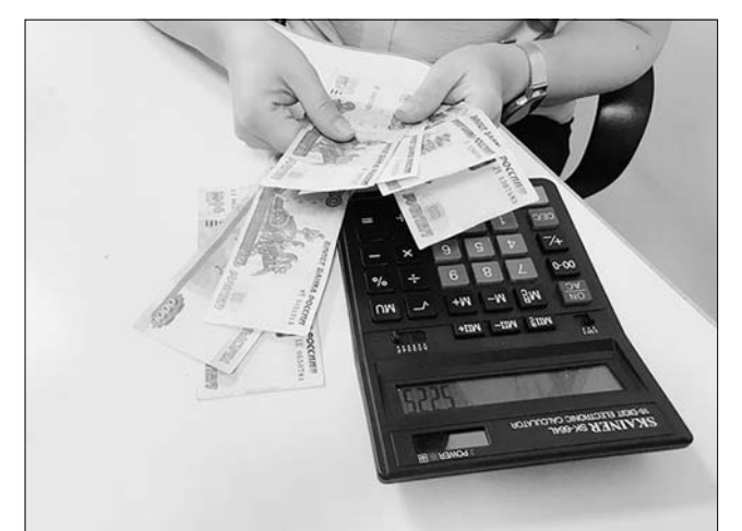
Мера поддержки была введена в стране по поручению Президента России Владимира Путина.

Премьер-министр Михаил Мишустин подписал распоряжение о дополнительном выделении регионам почти 62 миллиардов рублей на ежемесячные выплаты на детей от 3 до 7 лет. Забайкальский край получит из этих средств 1 миллиард 95 миллионов рублей.