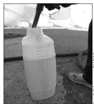
Было похищено около 50 тысяч литров дизельного топлива.

Сотрудники Забайкальского ЛУ МВД России на транспорте завершили расследование уголовного дела по факту кражи дизельного топлива с тепловозов на железной дороге, совершенной организованной группой.