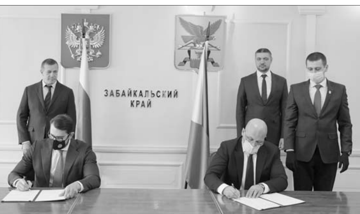
Подписано соглашение АО «КРДВ» с ПАО «ППГХО» о получении статуса резидента ТОР «Краснокаменск».

производстве, которое за январь-сентябрь 2020 года сократилось на 1,6%. При этом объём строительных работ вырос на 35%, рост инвестиций в основной капитал составил 52,9%.