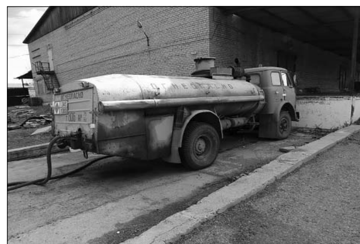
Излишки обвиняемые сливали в ночное время в бензовоз руководителя группы.

— Руководитель группы стремился вовлечь как можно больше работников локомотивных бригад, которые работали на разных тепловозах, так как отдельно друг от друга они могли сэкономить и слить больше дизель-