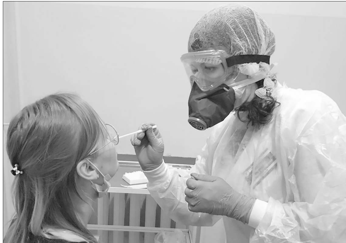
Новые санитарные правила позволяют выписывать пациента из стационара на долечивание дома до получения отрицательного результата исследования.

Негативное влияние на экономику региона оказали ограничения, вызванные распространением коронавирусной инфекции. В особенности это отразилось на промышленном