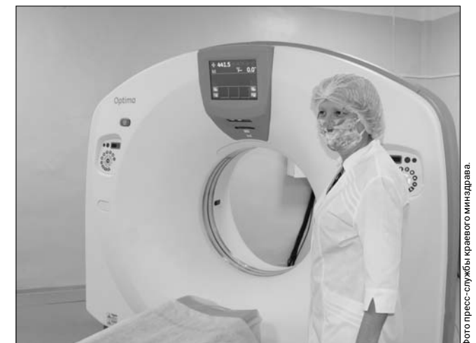
Новый аппарат КТ позволит улучшить диагностические возможности больницы.

В краснокаменской краевой больнице № 4, на базе которой действует моностаціонар для больных коронавирусом, запущен в работу новый компьютерный томограф.